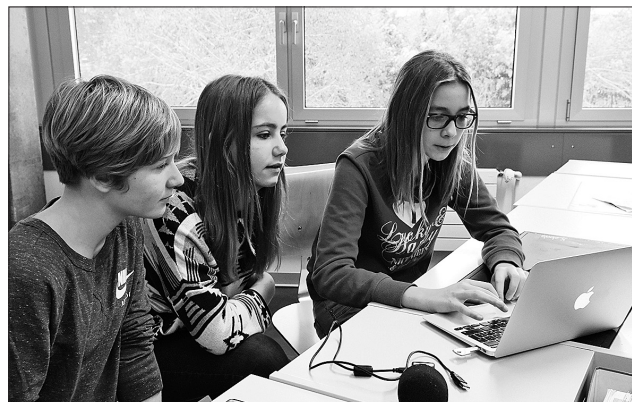
Teamarbeit in beiden Sprachen