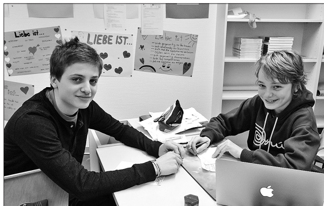
Die Radioarbeit machte auch Spass.