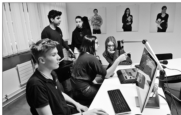
Klare Absprache beim Sendepult

Mikrofons», «Die Arbeit des Moderatoren-Teams» und «Mein gut organisiertes Interview». Jedes Team organisierte sich für seine Sendung selbst und kontaktierte die Interviewpartner. Die Schülerinnen und Schülern hatten ein zeitlich abgestimmtes Programm zu erfüllen. Auf der Internetseite von Radio Chico gibt es ein Podcast-Archiv. www.radiochico.ch