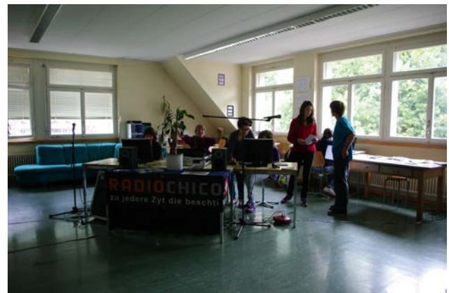
Das eingerichtete Studio in der Schule Wilderswil

http://radiochico.jimdo.com/4-schulen/schule-wilderswil-20-4-2011-24-4-2011/