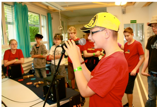
‚CoolTour‘ Bern: Die Freude am Radiomachen steht den sehbehinderten Jugendlichen im Gesicht geschrieben.